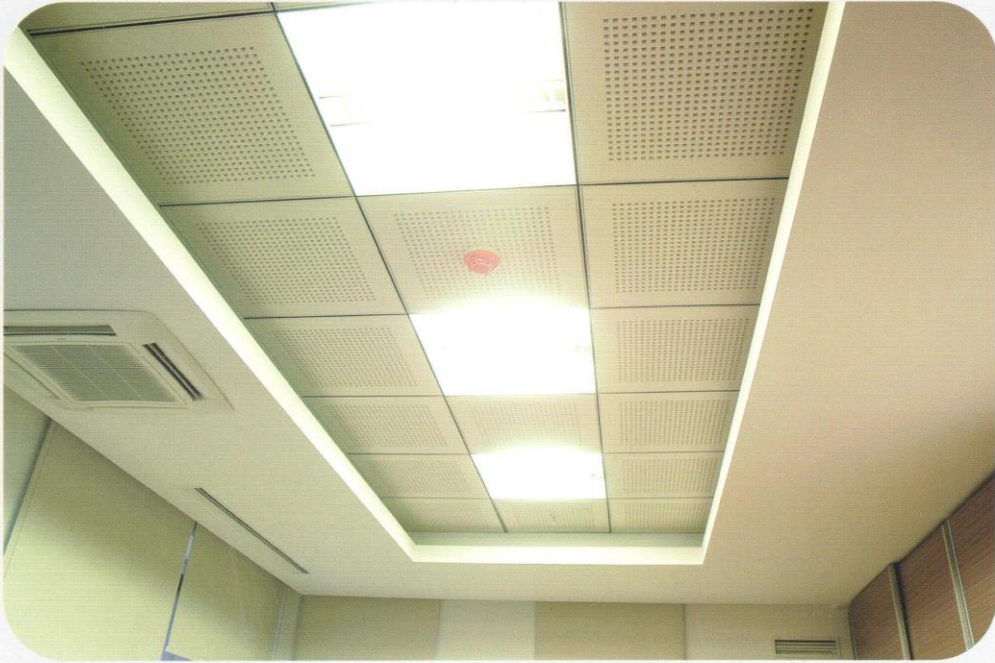
Alçıpan ve Vinil Uygulamalı Asma Tavan

Alçıpan, ortası alçı iki yüzü karton kaplı, seri olarak, standart ve özel boyutlarda ve belli normlarda üretilen düzgün yüzeyli plakalardır. Alçıpan bir iç mekan yapı malzemesidir. Kullanım amacına göre alçı harcına katılan kimyasallar sayesinde değişik tiplerde üretilabilmektedir.