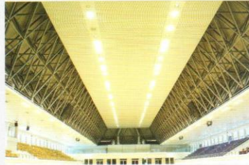
Alçıpan Tavan Sistemi Spor Salonu Çalışması