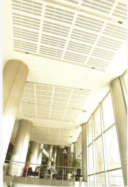
Alçıpan Akustik Asma Tavan